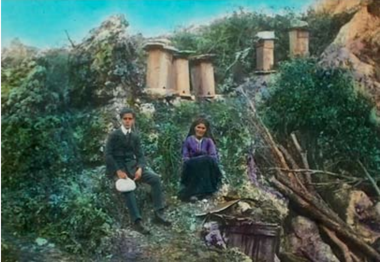
Nepoznati autor, Pčelinjak (iz okoline Cetineja) kolorisani dijapozitiv, oko 1911.

<<< Nepoznati autor, Bez naziva, dagerotipija, početak druge polovine XIX v.