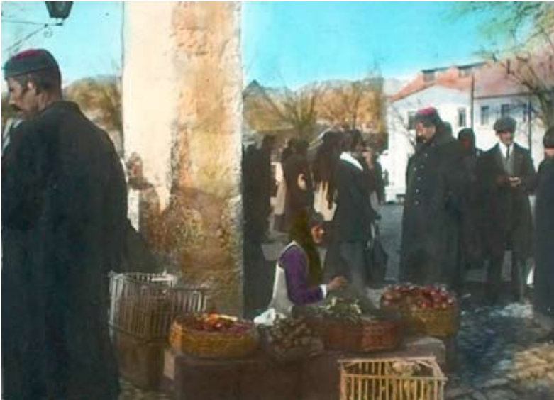
Nepoznati autor, Balšića pazar kolorisani dijapozitiv, oko 1911.