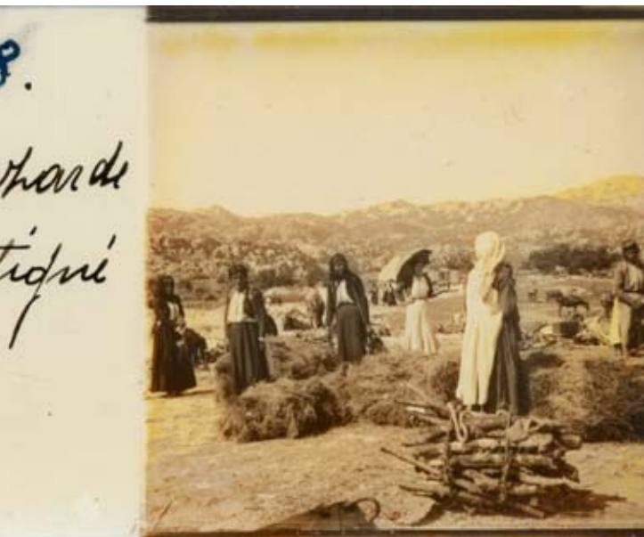
Pazar drva tonirani stereoskopski dijapozitiv, oko 1910.