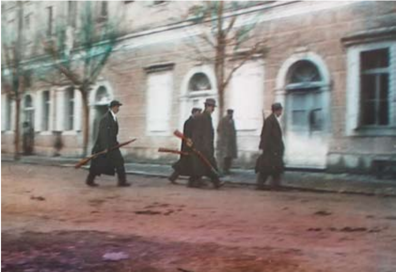
Nepoznati autor, Crnogorci emigranti odlaze u rat (Podgorica) kolorisani dijapozitiv, 1912.