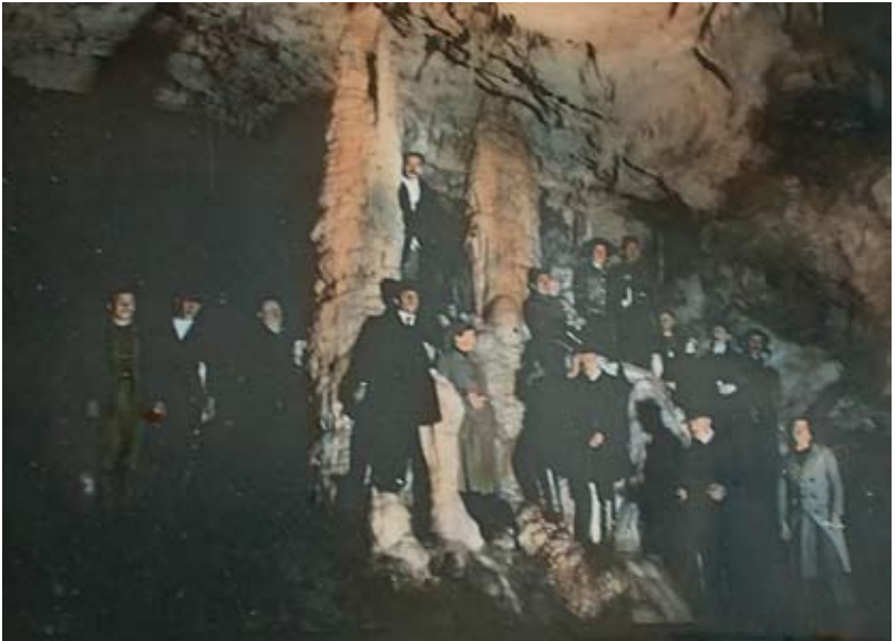
Nepoznati autor, Lipska pećina kolorisani dijapozitiv, oko 1911.