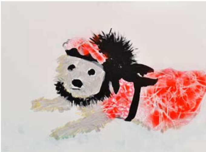
kombinovana tehnika, 50 x 70 cm, 2008.