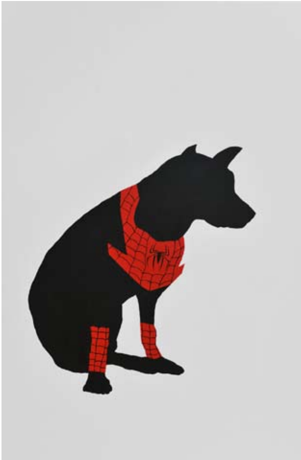
kombinovana tehnika, 235 x 155 cm, 2008.