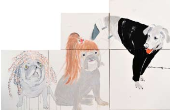
kombinovana tehnika, 100 x 130 cm, 2008.