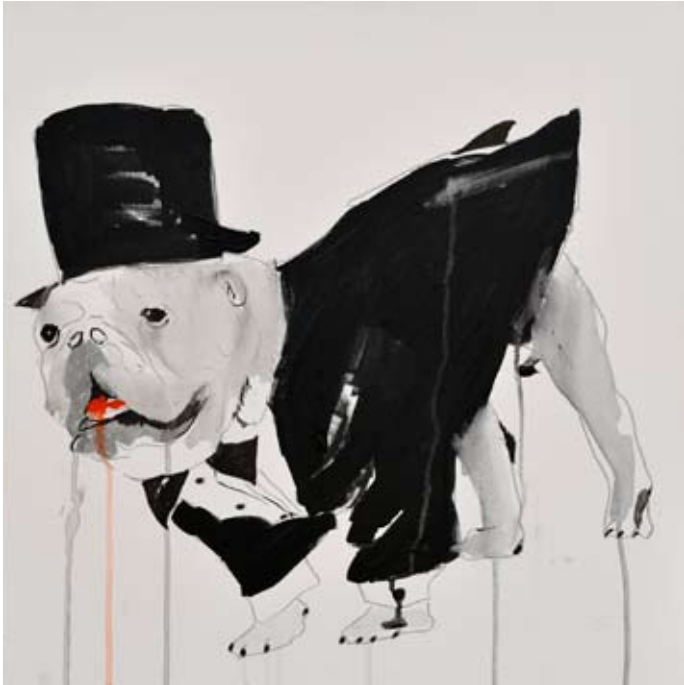
kombinovana tehnika, 50 cm x 50 cm, 2008.