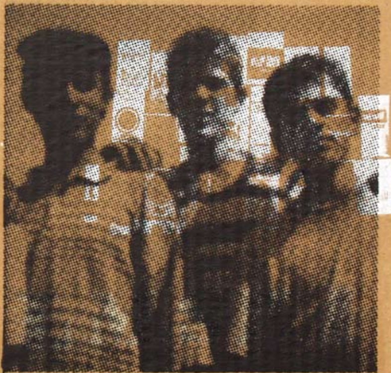
Bez naziva, 2004/2005, sito štampa na ljepenci (42x23cm)

one topološke prostore gdje se umjetnička «aura» zadobija, neosporno legitimizovani kao umjetnička djela. I mi, posmatrači, da se još jednom poslužim Grojsovim idejama, kao neka vrsta intelektualnih flanera, dakle duhovnih lutalica, dolazeći u ovakve prostore na neku vrstu poklonjenja, kroz čin «profanog prosvjetljenja» otkrivamo «auratičnost» u djelima koja u svojoj temeljnoj prirodi, poput ovih koje večeras vidimo na sjajnom Rakčevićevom FRIZU, podrazumijevaju mogućnost kopiranja i bekrajnog multiplikovanja.