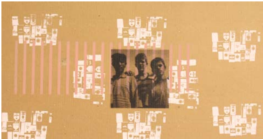
Bez naziva, 2004/2005, sito štampa na ljepenci (74x38cm)