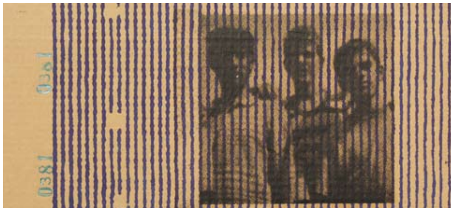
Bez naziva, 2004/2005, sito štampa na ljepenci (39x22cm)

Mislim da na taj način u datim društvenim okvirima doprinosim više nego da je moj rad usmjeren ka stvaranju "lijepe" umjetnosti.