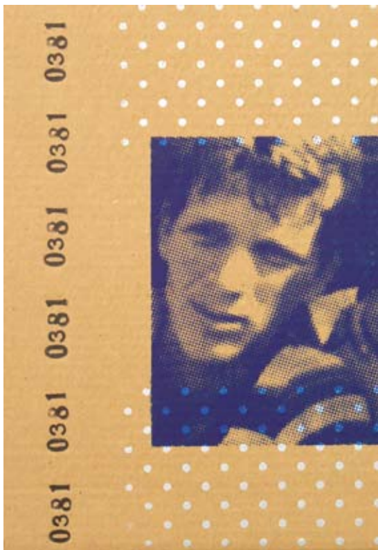
Bez naziva, 2004/2005, sito štampa na ljepenci (30x42cm)

O čemu se, dakle, radi? Najprije, nešto o ovom «lokalnom kontekstu»: ko su ljudi čije obrise naslućujemo u Rakčevićevim radovima? U kom i kakvom svijetu oni žive? Nema sumnje, namah je razabirljivo: ovo su ljudi sa «periferije», sa «margine», ne slučajno fotografisani «u samom srcu socijalne stvarnosti», na kamionskim i inim pijacama, u socijalnom polju sklonjenom od «blještave svjetlosti i lažnog sjaja prestižnih, etabliranih društvenih pozornica», ljudi pretvoreni u «obris» realnih figura, tehnikom sitoštampe depersonalizovani u mjeri koja inteligentno čuva mogućnost naslućivanja nekog , da, upravo tako: nekog , konkretnog ljudskog bića; ovo su ljudi svedeni na ravan serijskih brojeva, multipla, dezena, mustri i paterna, dizajniranih omotača industrijskih proizvoda, među kojima najčešće naslućujemo paklice cigareta, skoro bismo mogli reći svojevrsnog «zaštitnog znaka» najdublje socijalne drame tokom naših potonjih bezmalo dva desetljeća: ovo su multiplikovani ljudi-sjenke, ljudi-sablasti, dakle «prividi» čija se, avaj, prividnost u polju naše refleksije ukazuje i sama kao «kočinje-privid», dakle kao «prividna prividnost», a zapravo kao stvarnost stvarnija od svake «stvarne» stvarnosti;