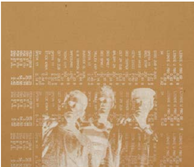
Bez naziva, 2004/2005, sito štampa na ljepenci (70x60cm)